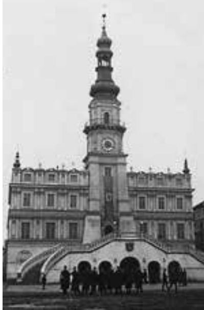
Zamojski ratusz. Rok 1942.

lekcjonowane po badaniach przeprowadzonych w obozach przejściowych. Trafiły one do Rzeszy w celu germanizacji. Część z nich przebywała czasowo w tzw. domach wychowawczych mieszczących się na ziemiach polskich wcielonych do Rzeszy. Najmłodsze trafiały do niemieckich rodzin adopcyjnych. Nieznana jest dokładna liczba zrabowanych dzieci, historiografia posługuje się liczbą 4,5 tys. Wiemy, że w Łodzi, w obozie przy ul. Przemysłowej i w ośrodku ra-