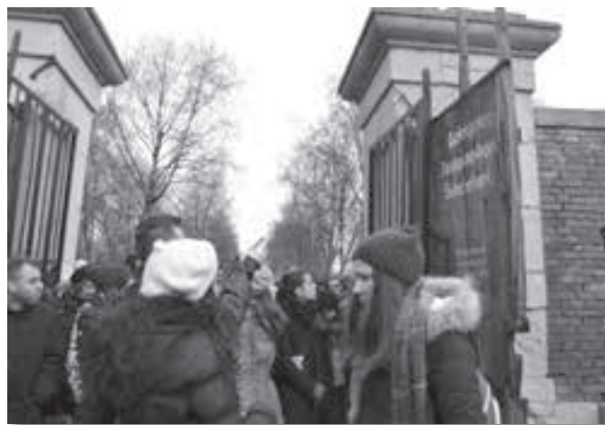
Uczestnicy projektu w zamojskiej Rotundzie