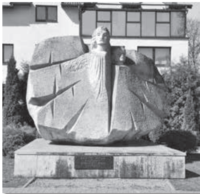
Pomnik Dzieci Zamojszczyzny