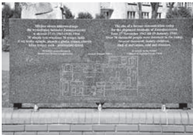
Tablica pamiątkowa w miejscu obozu w Zamościu