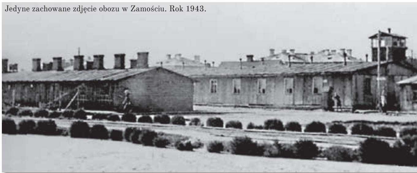
Jedynе zachowane zdjęcie obozu w Zamościu. Rok 1943.